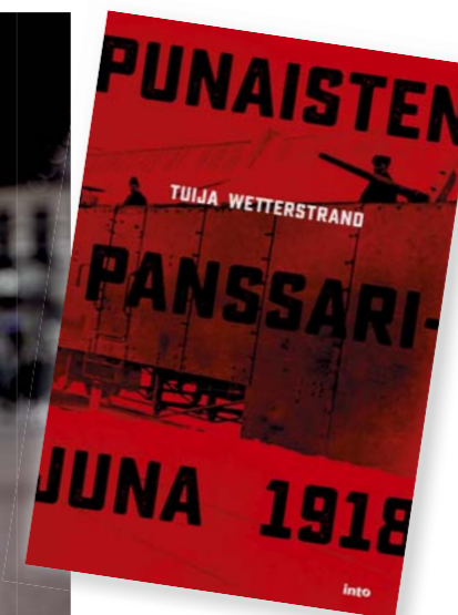
Tuija Wetterstrand kustantajan kuvassa ja Punaisten panssarijuna 1918 -kirjan kansi. Kirjassa on 260 sivua ja siinä on mustavalkoisia kuvia. Tuijan kuva: Nauska. Kannen valokuva: Topfoto / Lehtikuva.

nan kirja Suomen kalliomaalaukset – bongarin käsikirja ilmestyi vuonna 2013. Kirjan facebookisivulla on runsaasti kuvia ja tietoa kalliomaalauksista. Suomi 100 -juhluvuonna siellä esitellään 100 parasta kalliomaalausta.