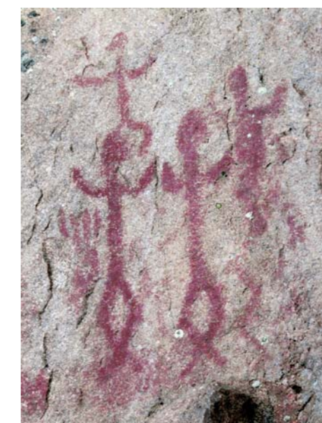
Yksityiskohta Kirkkonummen Juusjärven kalliomaalauksesta, joka mahdollisesti esittää rituaaliantasia. Kuvassa on neljä ihmishahmoa, joilla kaikilla on kädet kohotettuna ns. adorantti- eli palvontasentoon. Mahdollisesti tapahtumassa kuvataan shamaania ottamassa apuhengen eli jonkin eläimen hahmoa matkalla aliseen maailmaan

Kalliomaalauksia: www.facebook.com, hakusana Suomen kalliomaalaukset